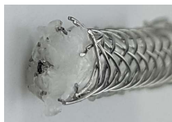
Sensorkabel durch Hitzeeinwirkung: Innenleiter macht Kurzschluss mit dem Außenleiter