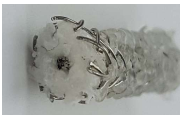
Sensorkabel noch Original: Innenleiter in der Mitte

Wird das Sensorkabel in waagerechter Einbaulage, Temperaturen über ca. 200°C ausgesetzt, welches an eine Messdose FKMD-xx angeschlossene ist, so steigt der Messwerte sprunghaft auf den Maximalwert an und es wird sofort Alarm ausgelöst. Fazit: Zwischen Innen- und Außenleiter kommt es zum Kurzschluss, da sich der Innenleiter durch die Schwerkraft absenkt, also der niedrigste Isolationswiderstand wird erreicht..