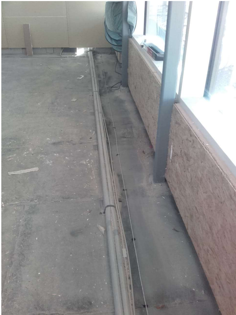
Verlegung des Feuchte-Sensorkabel an den Wasserführenden Leitungen