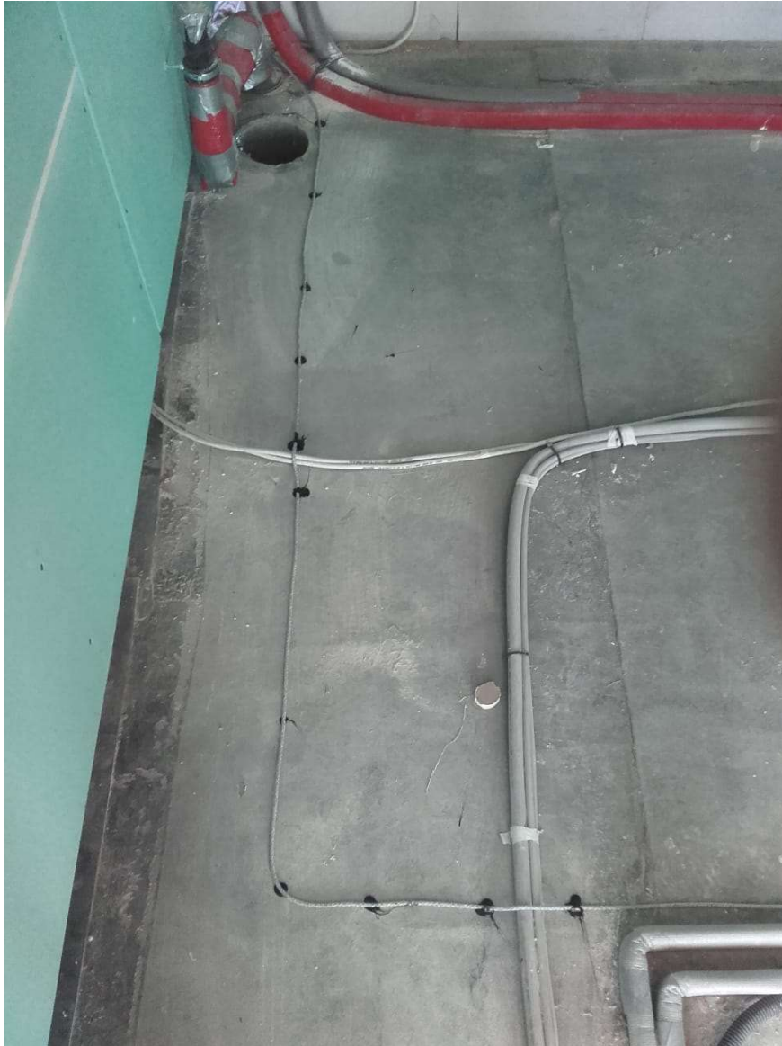
Verlegung des Feuchte-Sensorkabel am Wasseranschluss und Abwasseranschluss