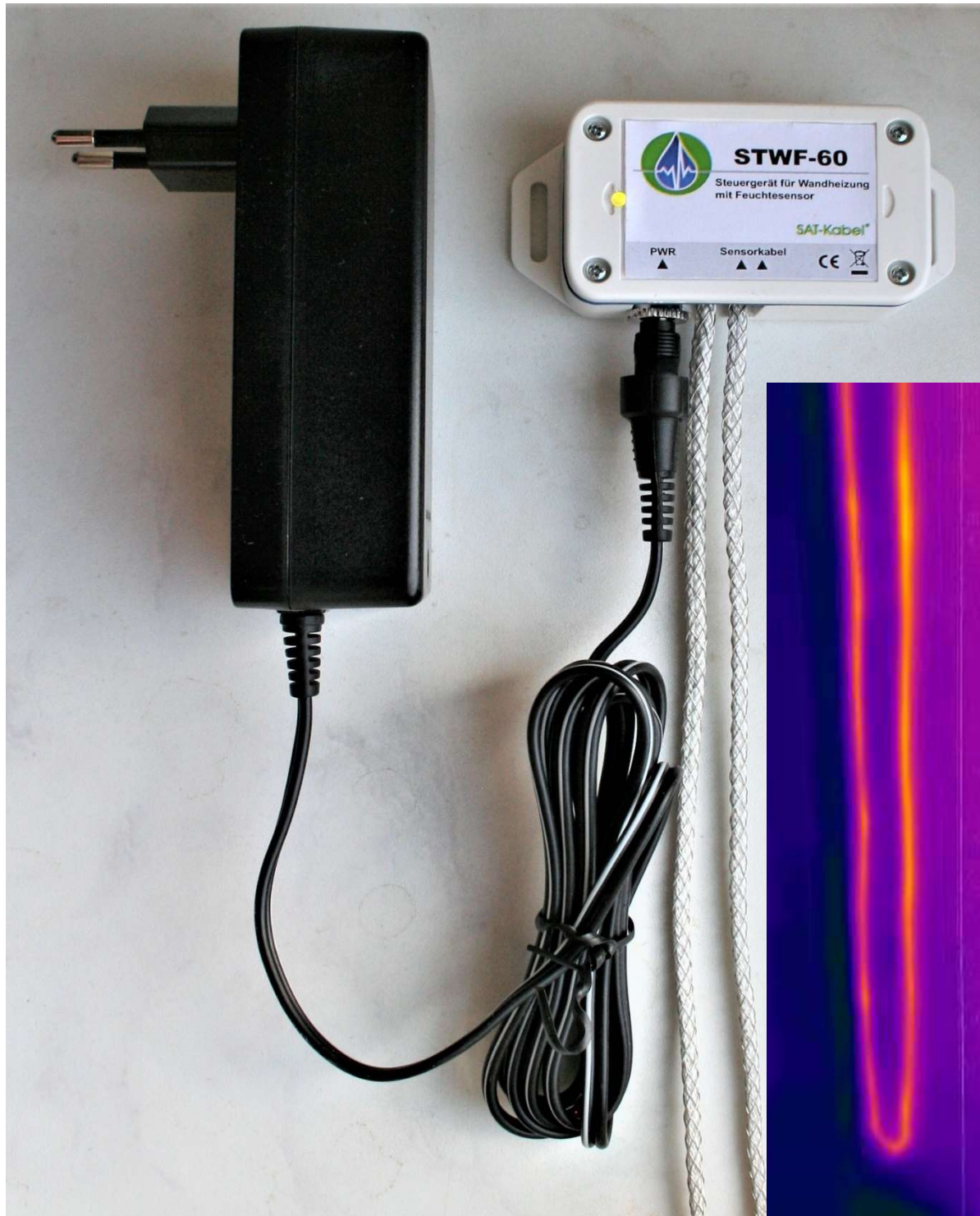
Bild mit der Wärmekamera

Einfache Montage im 3 mm Mauerschlitze und nur noch verspachteln.